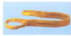
加保护的扁平吊索