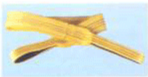
环眼扁平化纤吊索