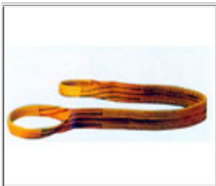
加保护的扁平吊索