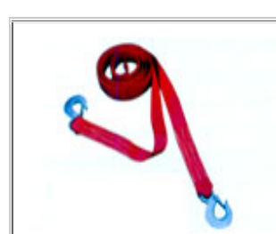
轿车及卡车牵引带